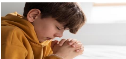
igualmente las imágenes subsiguientes

Los que apoyan estas decisiones del Tribunal Supremo insisten que más bien que restringir la libertad religiosa éstas acrecientan y aumentan dicha libertad, pues en virtud de evitar dar un lugar especial a una religión en particular, las decisiones del tribunal garantizan la libertad de todas las religiones.