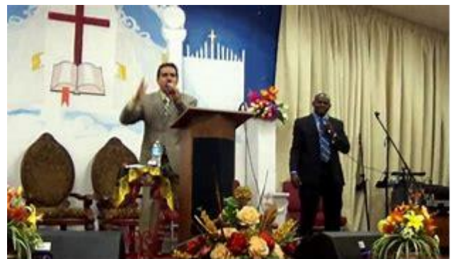
Proverbios 3:31 Reina Valera Actualizada 31 No envidies al hombre violento ni escojas ninguno de sus caminos;

Para el cristiano ordinario, la complejidad del debate puede ser parecido a los ángeles teológicos bailando sobre la cabeza de un alfiler. ¿Importa el uso de “en” en el gran plan de la vida? Además de todo esto, ¿por qué a las mujeres educadas y competentes deben ser negadas las carreras de servicio a Dios y a su pueblo? Y todavía, permanece la inconveniencia peculiar de la biología, de los hombres anhelando a estar con las mujeres y dejando a su padre y su madre para aferrarse a ellos, y de la iglesia, ese misterio extraño que trae al pueblo junto semana tras semana para escuchar a la exposición de la Escritura y luego, caminar en frente y recibir el pan y el vino. Juntos ellos señalan una gran verdad a un mundo estropeado y confuso. Cristo, el novio, en la pasada eternidad estaba dando una Novia por su propio Padre. Del cielo Él vino y la buscó. Él la llevó para arriba y unió a si mismo a ella para que ellos pudieran ser uno para siempre. Cada pareja casada está unida igualmente juntos por Dios para que por sus vidas ellos puedan contar la historia de Cristo y su iglesia. Todos los creyentes están reunidos en esa multitud, la iglesia, la Novia de Cristo y dejado en una congregación donde, mediante sus pastores, el esposo divino ame a su pueblo hasta el final. □